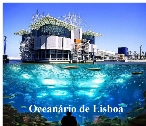
Oceanário de Lisboa