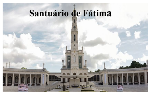
Santuário de Fátima