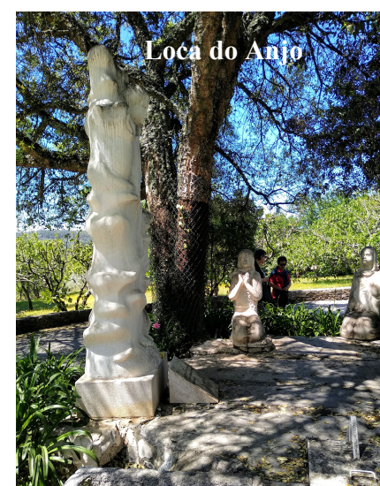
Loca do Anjo