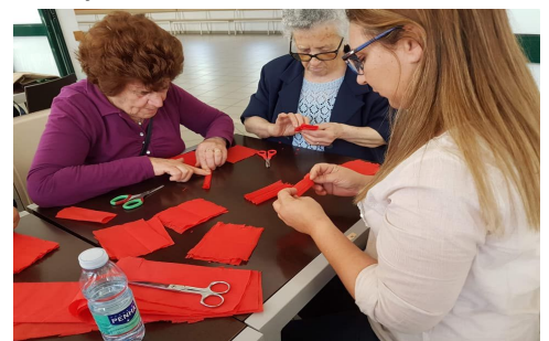
workshop de cravos

Resta acrescentar, que no final das atividades e passeios houve sempre um pequeno lanche oferecido pelo “Centro de Convívio da ARPI” a todos os participantes.