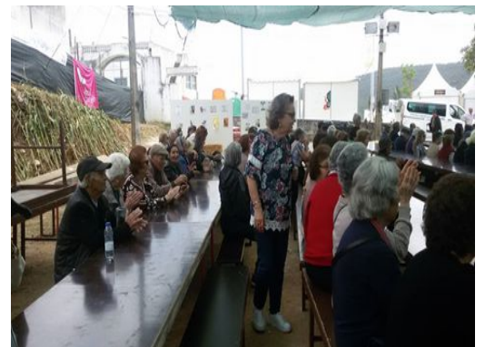
Festa da Espiga